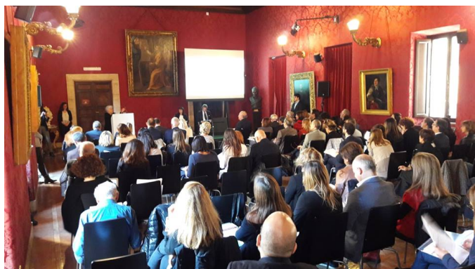
Evento 07 febbraio

Sul sito internet www.salutebenedadifendere.it e la pagina Facebook www.facebook.com/salutebenedadifendere è possibile trovare maggiori informazioni e aggiornamenti sul progetto.