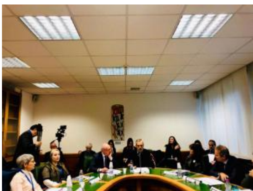
Evento 06 dicembre