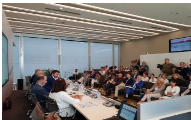
Evento 18 luglio