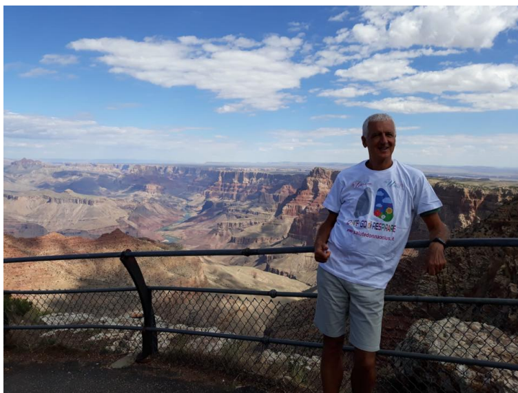
Trasferta al Grand Canyon - USA

Inoltre l'Associazione ha collaborato (realizzando un catering per 300 persone) all'evento " World No Tobacco Day ", tenutosi il 31 maggio presso l'Istituto Tumori. Per l'occasione i volontari di Salute Donna hanno indossato la nuova maglietta divulgativa (vedasi foto).