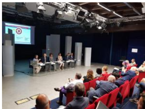
Evento 18 giugno