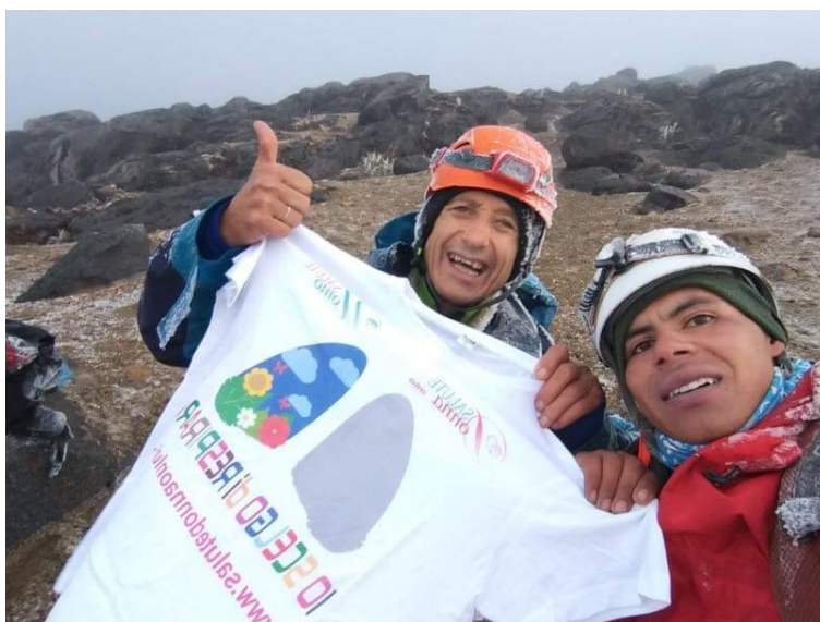
Trasferta al Vulcano Tolima - Colombia